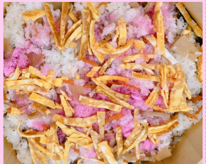
桜入りのちらし寿司